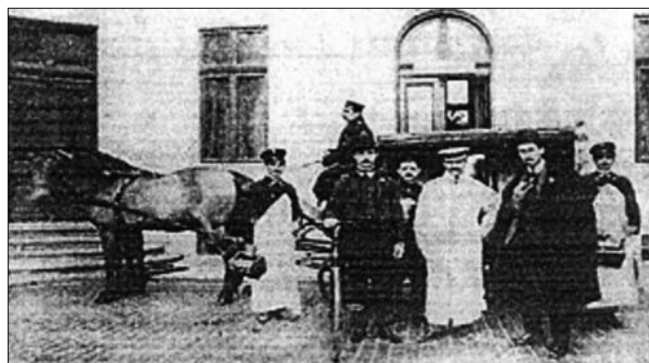
Figura 3. Grup de medici și sanitari în curtea Salvării. Trusa de prim ajutor era dusă de un sanitar pe bicicletă, în urma birjei. Începutul secolului XX. (5)