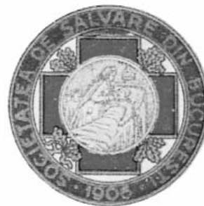
Figura 1. Emblema Societății de Salvare din București la constituirea acesteia (Arhiva Ambulanței București)

Comisia tehnică instituită de Ministerul Sănătății și Ocrotirii Sociale certifică necesitatea imediată a înființării