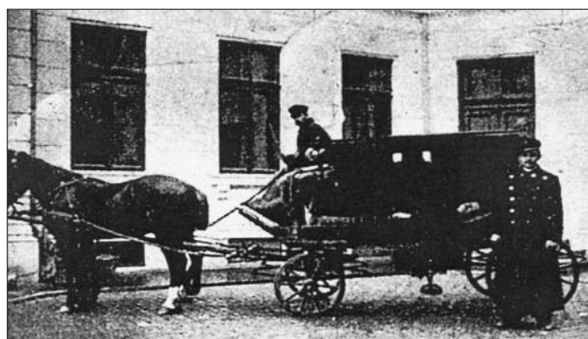
Figura 2. Prima ambulanță a Salvării, construită după modelul celei vieneze, prezentată la expoziția din 1906 (Arhiva Ambulanței București)